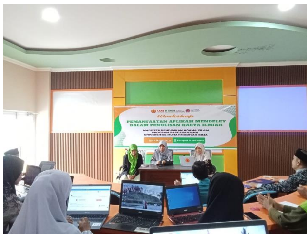
Gambar 1.3. Pemaparan materi oleh narasumber