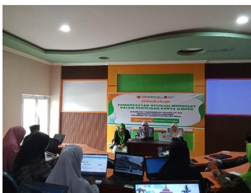
Gambar 1.2 Pemaparan materi oleh narasumber

Peserta, baik dari kalangan dosen maupun mahasiswa, diharapkan memiliki pemahaman yang lebih baik mengenai struktur penulisan karya ilmiah yang sesuai dengan kaidah akademik, serta mampu menyusun artikel secara sistematis dan logis (Irwan et al., 2022).